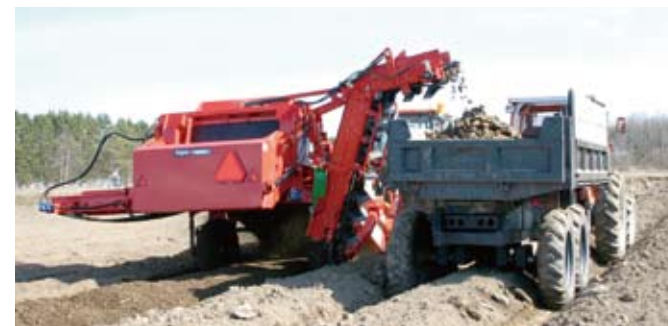
※エレベータ付きモデルご利用に際し、別途走行用トレーラが必要です。

当該モデルは高性能除礫機としてエレベータ付きストーンピッカーと兼用でご利用頂けます。エレベータはクロスコンベアにドッキング、切り離しを行い通常のセパレータとしてのご利用に制限はありません。エレベータの先端は「油圧角度調節式」でトレーラに平均に積み込むために不可欠な機構です。日本の標準的な75cm畦幅での伴走ではトレーラとの間隔を適切に保ちながら作業するために重要な機構です。これまで、石礫のため馬鈴しょ栽培をあきらめていた圃場への作付が可能となり、輪作地の拡大により、罹病のリスクを低減するためにも注目されているシステムです。高性能除礫と、使い易いエレベータアタッチは春作業が重なる繁忙期に短時間で馬鈴しょ圃場の造成に活躍する新しい作業体系としてご提案いたします。当該アタッチメントは工場取り付けとしてお受けいたします。その他、除礫機としてのご利用方法について事例をご紹介いたしますので、担当営業員にお訊ね下さい。